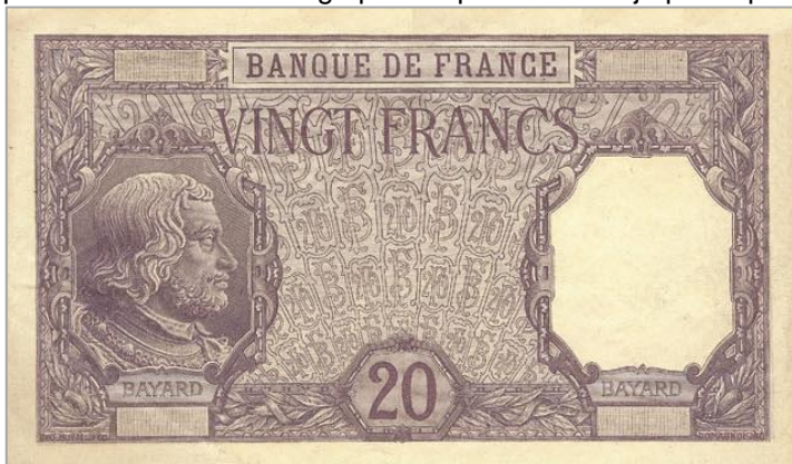
Épreuve de création

La première dominante choisie est le mauve ; la mention « BAYARD », portée deux fois, sera ensuite remplacée par la devise attribuée au chevalier, « SANS PEUR SANS REPROCHE », probablement pour renforcer le message patriotique délivré déjà par le portrait.