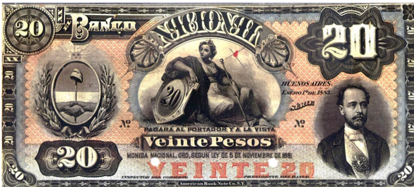
PS-718s NC- BN-164s prueba del anverso sin número sin série, con dos agujeros