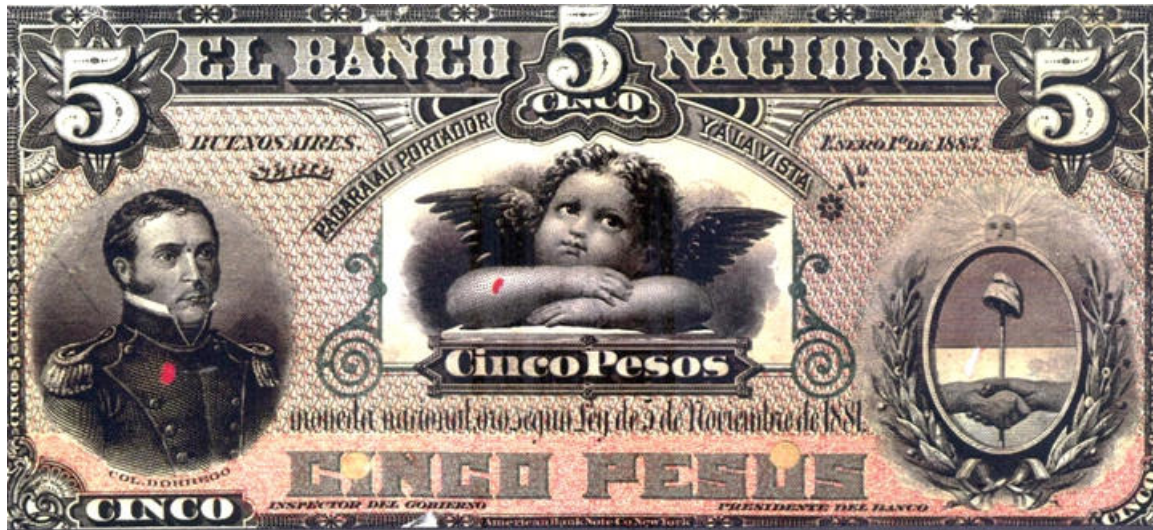
PS-716s NC- BN-162s prueba del anverso sin número con dos agujeros