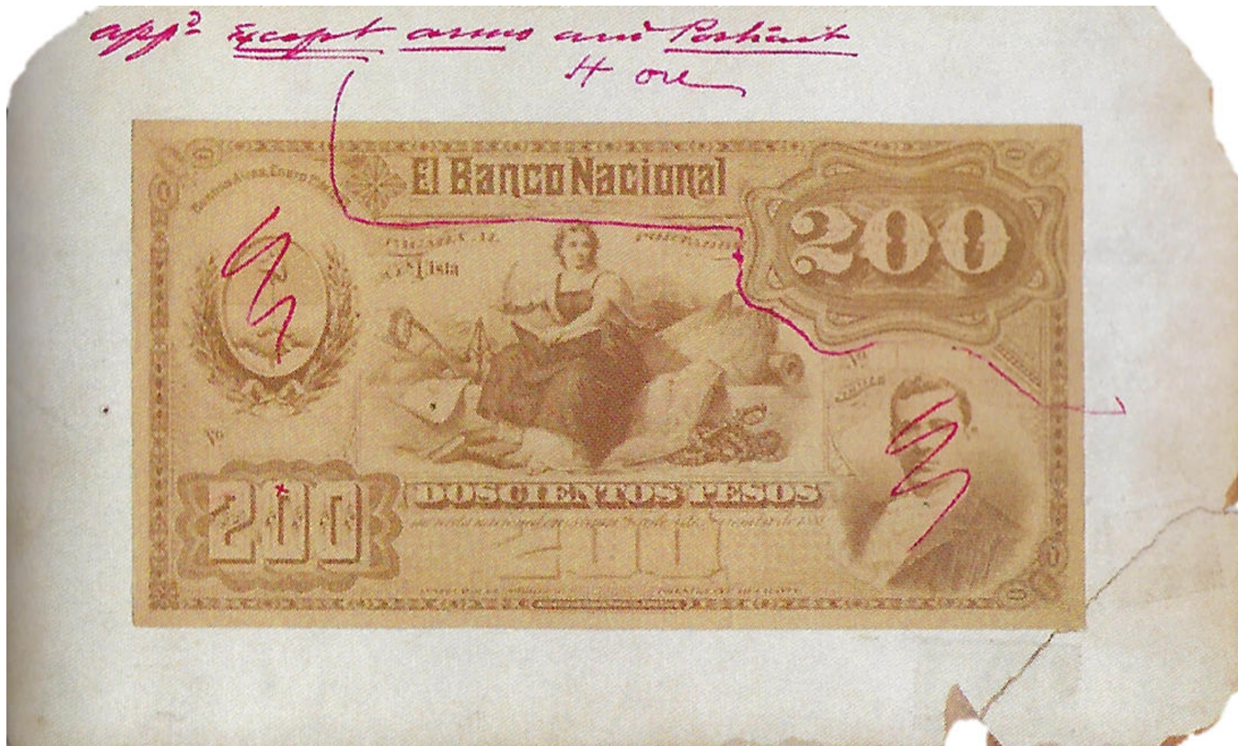
Proyecto con indicación de los cambios a realizar. El retrato aún no ha sido identificado.