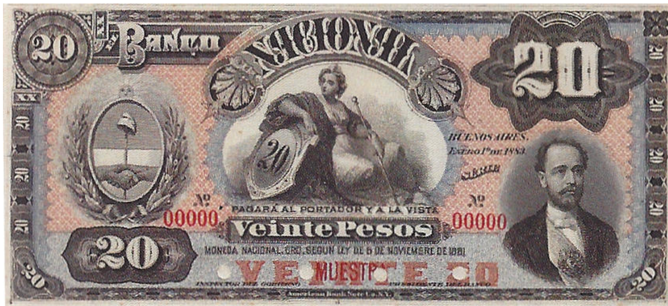
PS-718s NC- BN-164s Prueba del anverso sin série, con números 00000 resellado MUESTRA, con cuatro agujeros.