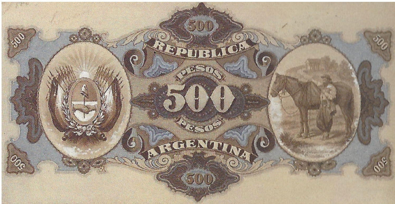
El diseño del reverso y los colores también recuerdan al billete uruguayo.