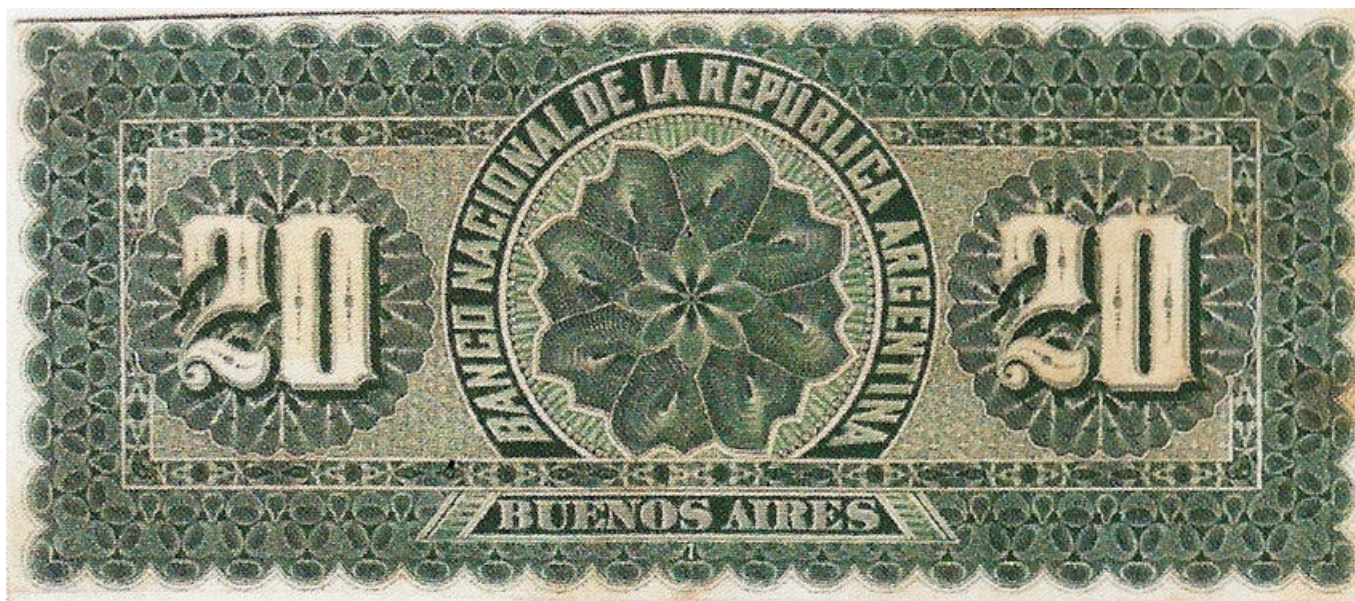
PS-718s NC- BN-164s Prueba del reverso sin perforar