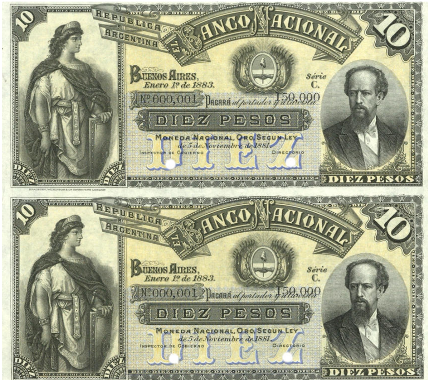
PS-702s NC-347 BN-148s spécimen d'archives avec numéros 000,001 et 150,000 deux perforations