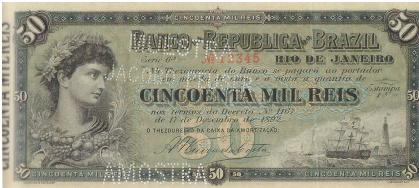
Giesecke & Devrient / Læmmert & C o utilizaron la viñeta de la joven en 1892/3 para un boleto brasileño.