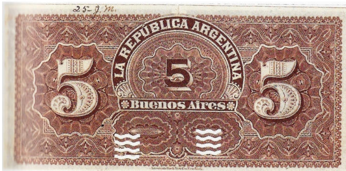
PS-716s NC- BN-162s prueba sin série ni número con perforaciones de olas