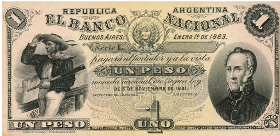
PS-694p NC-339c BN-140p épreuve de l'avvers sans numéro fond bleu et jaune au lieu de vert et rose sans perforation