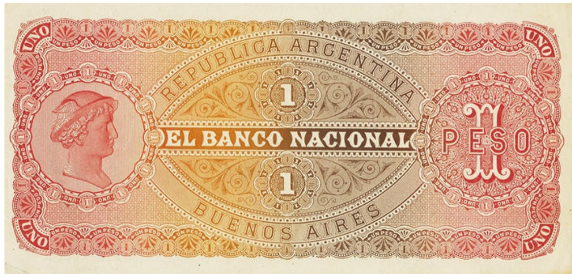
PS-694p NC-339d BN-140p épreuve du revers, sans perforation rouge / jaune / brun / rouge au lieu de vert / brun foncé / carmin / vert