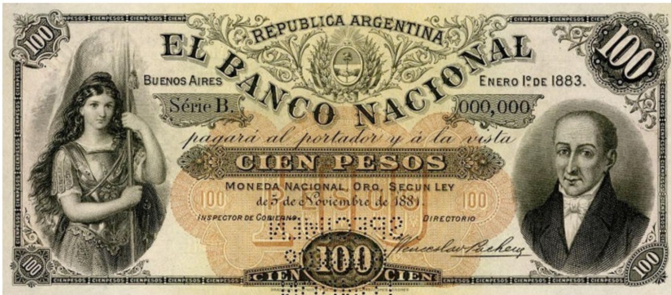
PS-701s NC-346 BN-147s espécimen con número 000,000 perforado SPECIMEN / BW&C° / LONDON