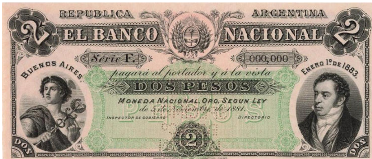
PS-695s NC-340 BN-141s Espécimen con número 000,000 Perforado SPECIMEN / BW&C° / LONDON