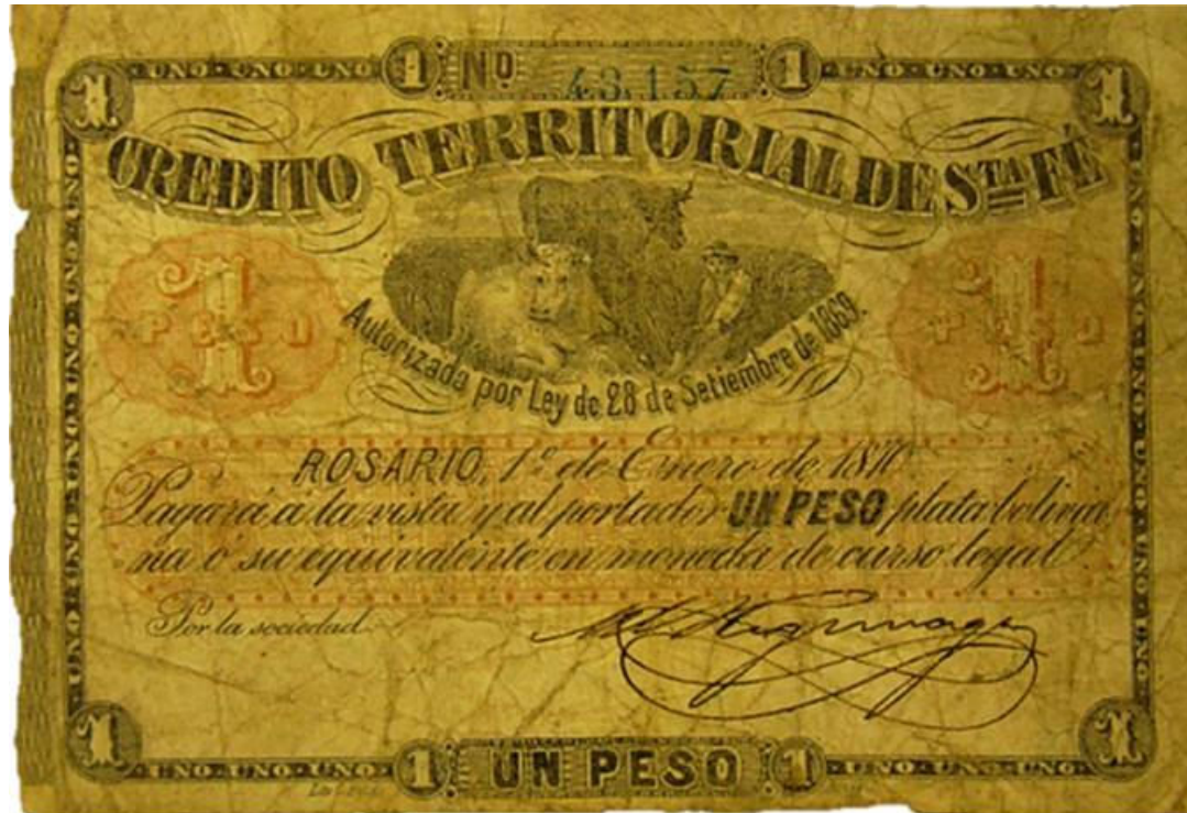
PS- CT-1E-3 SFE-192 numérotation mécanique à 5 chiffres en bleu avec séparateur après les milliers, signature autographe de Manuel Regúnaga