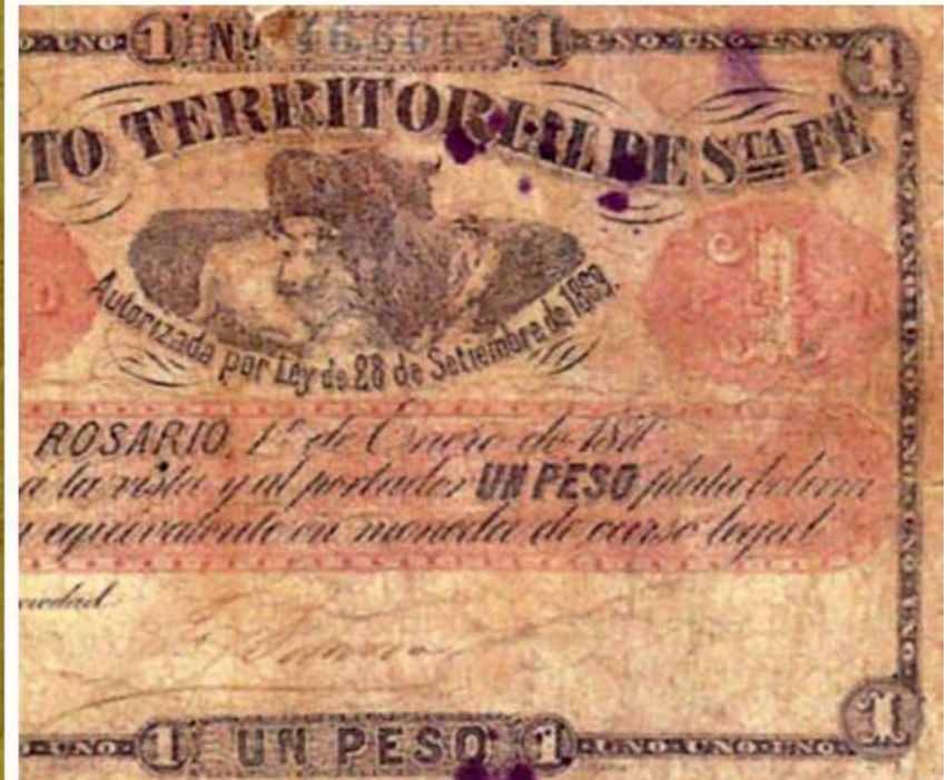
PS- CT-1E-3 SFE-192 numérotation mécanique à 5 chiffres en bleu avec séparateur après les milliers, signature autographe de Federico Somosa