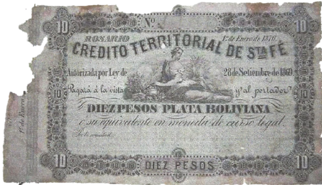
PS-1958 CT-1E-4 SFE-194r Forma con talón, sin firmar ni numerar..