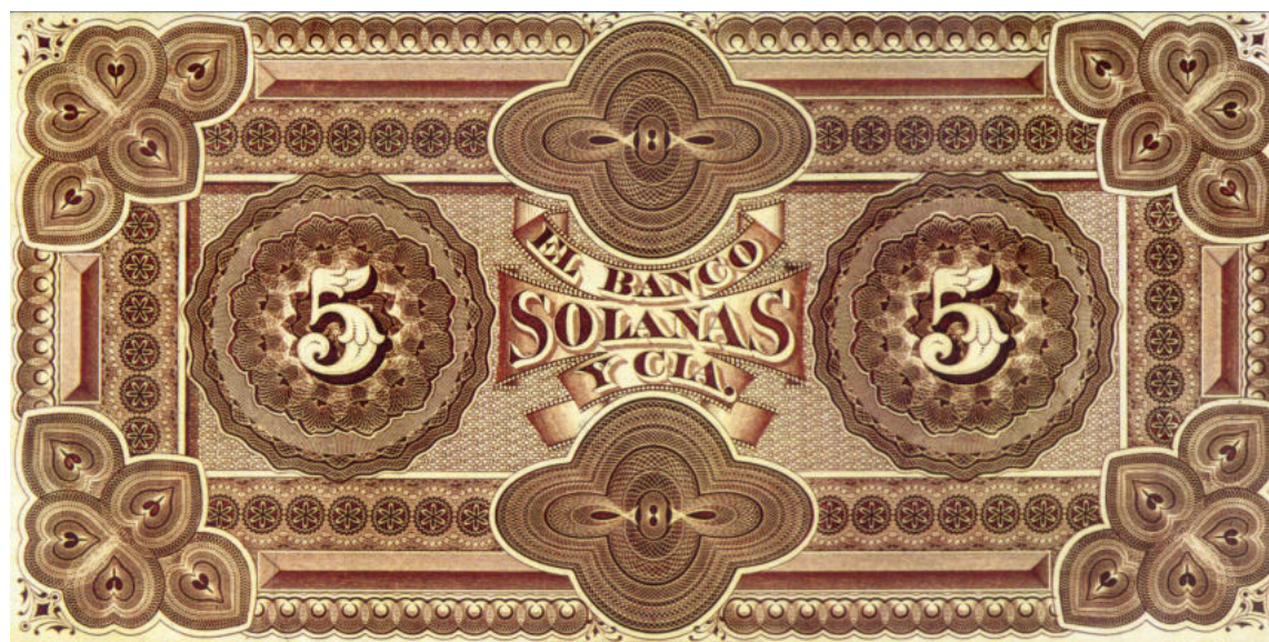
PS-1916p ENR-225p Épreuve du revers sur papier fin collé sur carton, sans perforations.