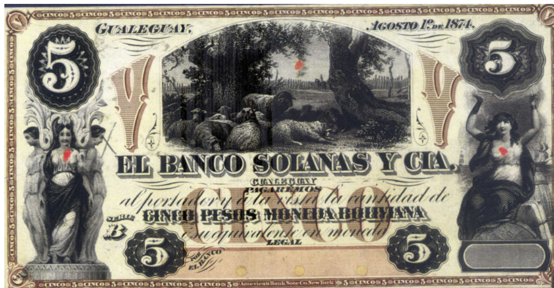
PS-1916p ENR-225p Épreuve de l'avant sur papier fin collé sur carton, sans numéro, avec 3 perforations.