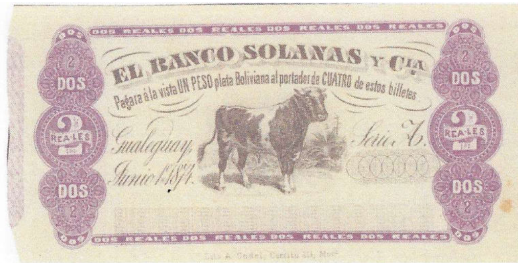
Photo Bauman PS-1912p ENR-221ct Prueba con fondo morado, sin perforar →

La prueba siguiente está fechada Junio 1º, 1874, mientras que la emission realitada tiene fecha de Agosto 1º, 1874 :