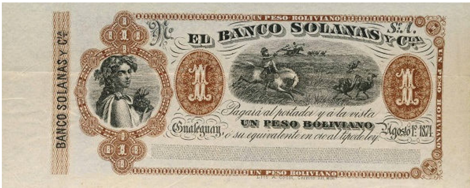
PS-1915p ENR-224p Formulario con talón Sin perforar, sin número.