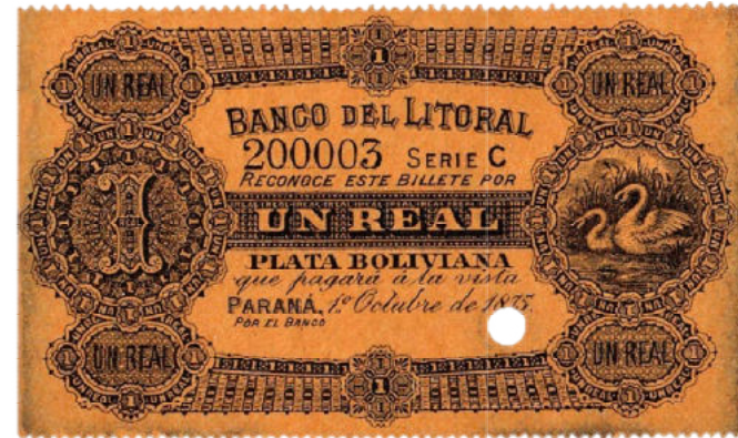
Photo Bauman PS-1704 ENR-203p Papier orange Numéro de début ou fin de série Annulé par perforation