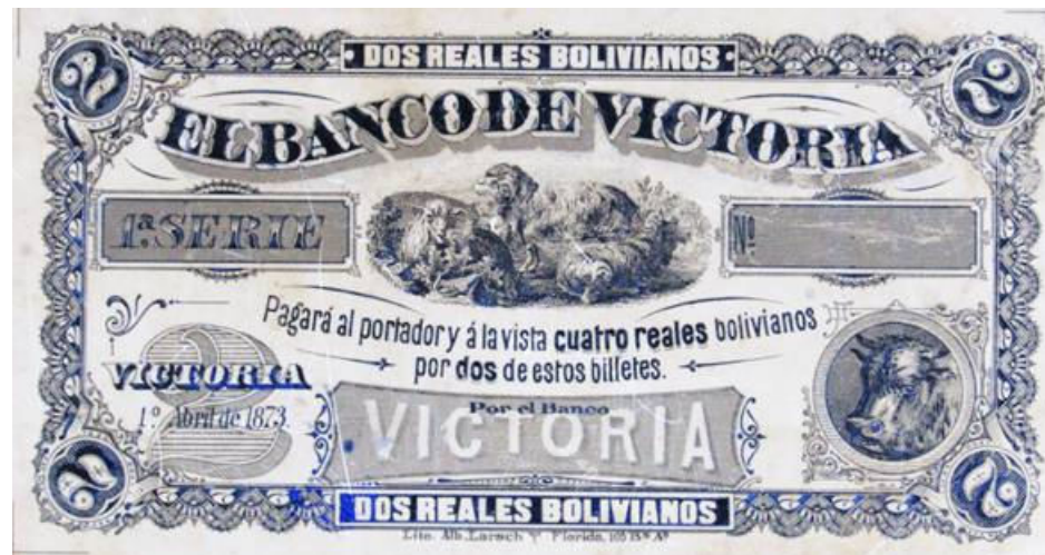
PS- ENR-214 Billet excédentaire