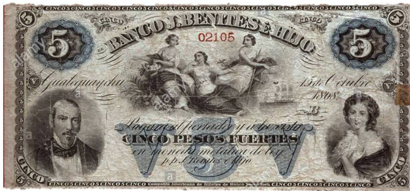
Le même billet est illustré chez Alamy, sans les graffitis, mais avec la signature du site.