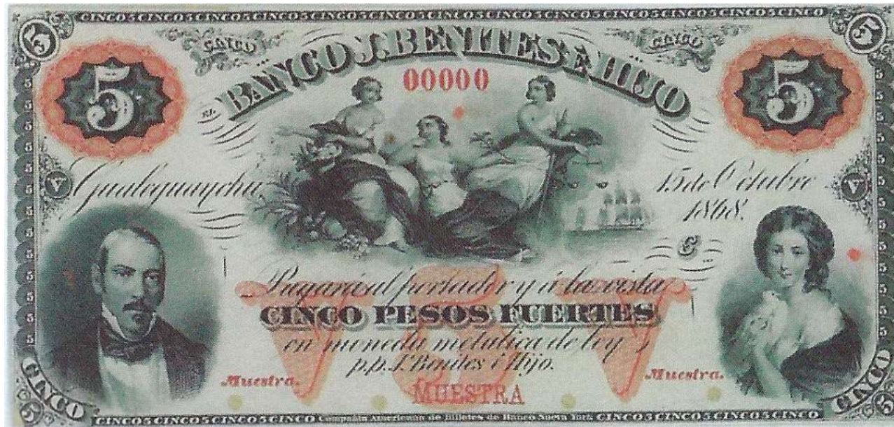
PS-1563 photoBauman ENR-99 Spécimen de l'avvers sur papier fin collé sur carton, Impression du fond rouge, numéro 00000 Numéroteur différent Surchargé Muestra MUESTRA Muestra Quatre perforations