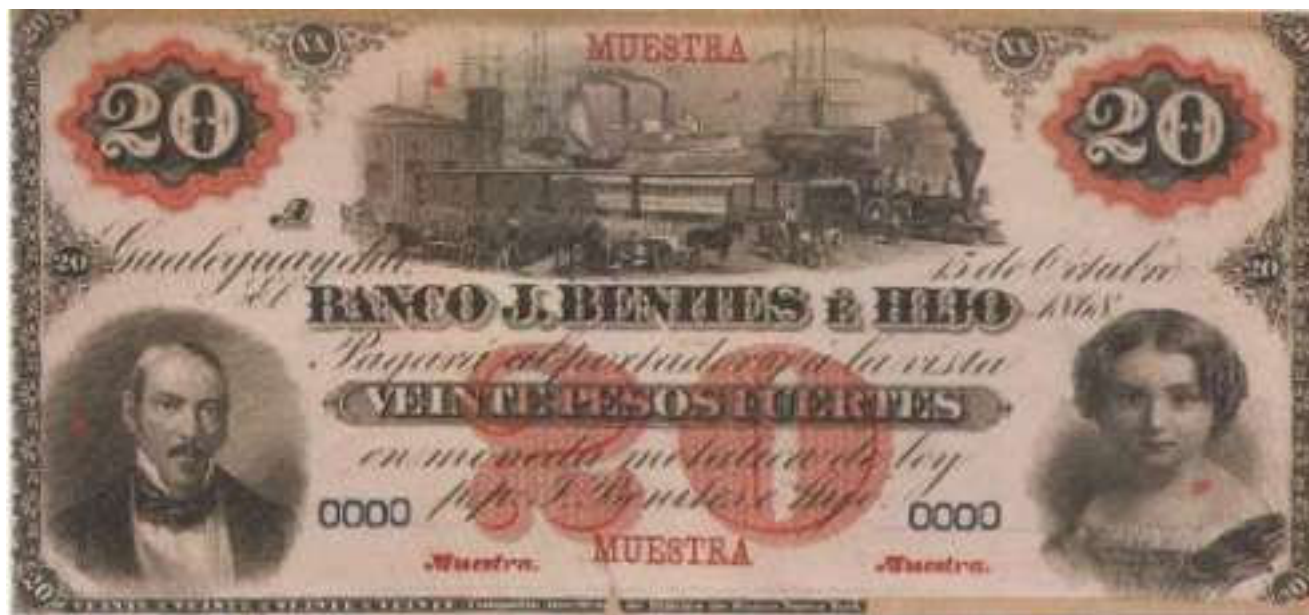
PS-1563 photoBauman ENR-99 Spécimen de l'avvers avec fond rouge brun, sur papier fin collé sur carton, Numéros 0000 2 x 2 surcharges MUESTRA / Muestra MUESTRA Muestra

Pas d'illustration du revers disponible pour l'instant.