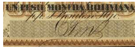
billet n° 16609

La position de la signature correspondant exactement à celle du billet numéroté de 1867 illustré plus haut, tout laisse à croire que pour une partie de l'émission au moins, la signature ait été incluse dans la plaque principale, la numérotation étant l'élément ajouté en dernier lieu.