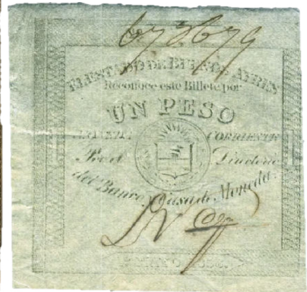
Firmado por León Vega placa extremadamente desgastada