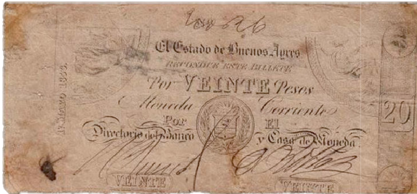
Firmado por M(ariano) Reynal / C(asimiro) Robles placa extremadamente desgastada