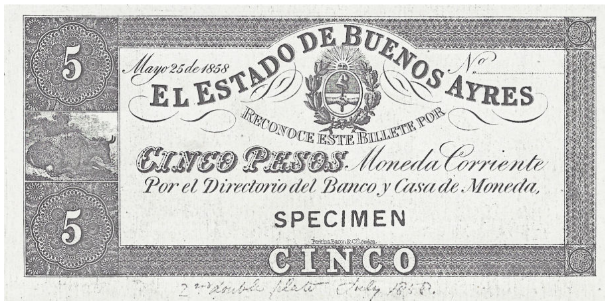
PS-430s NC-184a BA-82s Prueba en cartulina blanca con resello SPECIMEN