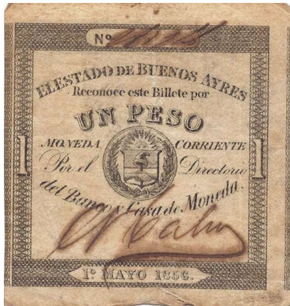
Firmado por Nicolás Calvo

marco ≈ 69 x 72 mm cantidad emitida : 1.928'000 filigrana : UN