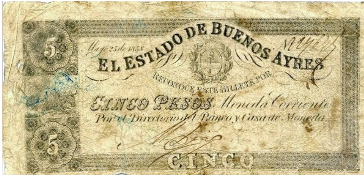
Firmante : Mariano Díaz