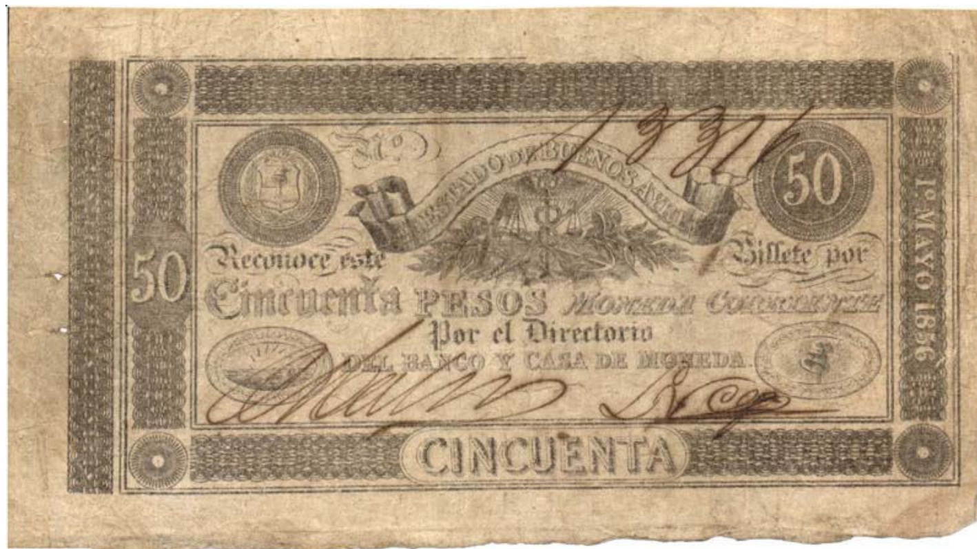
Firmado por Nicolás Calvo / León Vega

filigrana : escudo de armas del Estado, Cincuenta