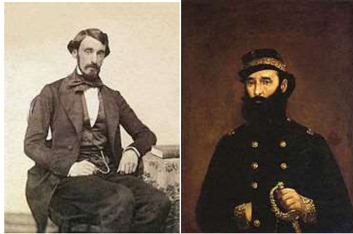
Bartolomé Mitre en ese momento del Estado de Buenos Aires... y en la Batalla de Pavón

Mientras la Confederación había acuñado algunas monedas en el sistema decimal, el estado de Buenos Aires se mantuvo fiel al antiguo sistema del peso por valor de 8 reales. Sin embargo, debido a la inflación, la moneda de 2 reales, o un cuarto de peso, y la de un real que vale un octavo de peso ya no se acuñaron en plata, sino en cobre. Estas acuñaciones tuvieron lugar en 1853 por el real y en 1853 - 1856, luego en 1860 y 1861, con un peso y diámetro reducidos, por las monedas de dos reales.