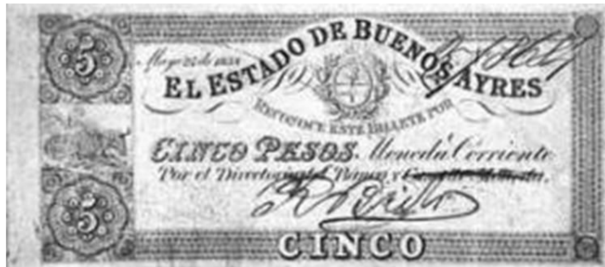
Firmante : Rafael Brito