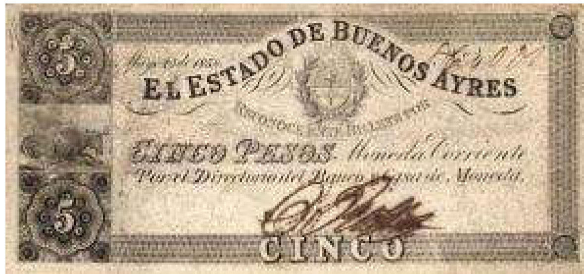
Firmante : Casimiro Robles