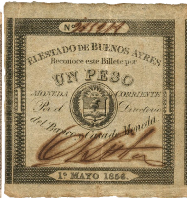
Firmado por Adolfo Lista