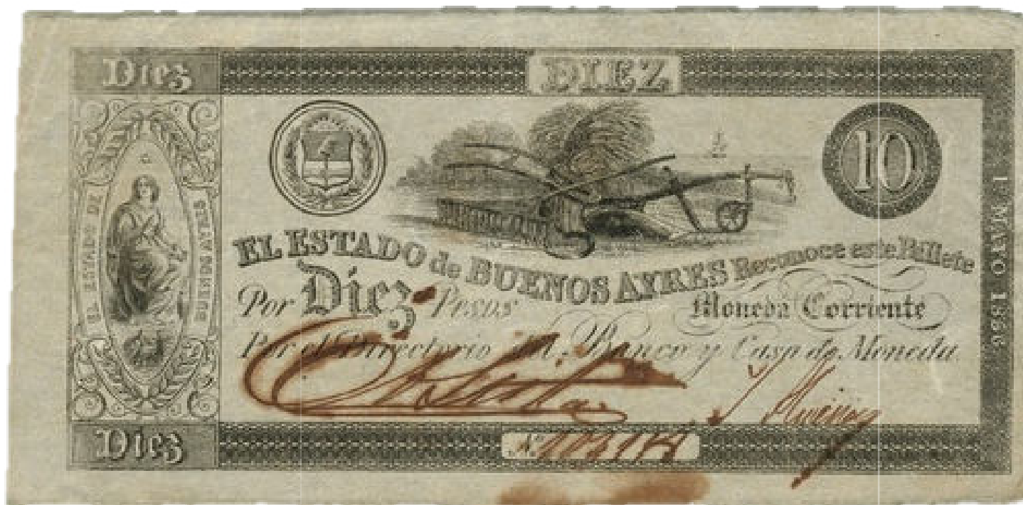
Firmado por Adolfo Lista / José Almeida

marco ≈ 175 x 78 mm cantidad emitida : 582'500 filigrana : Buenos Ayres / Diez