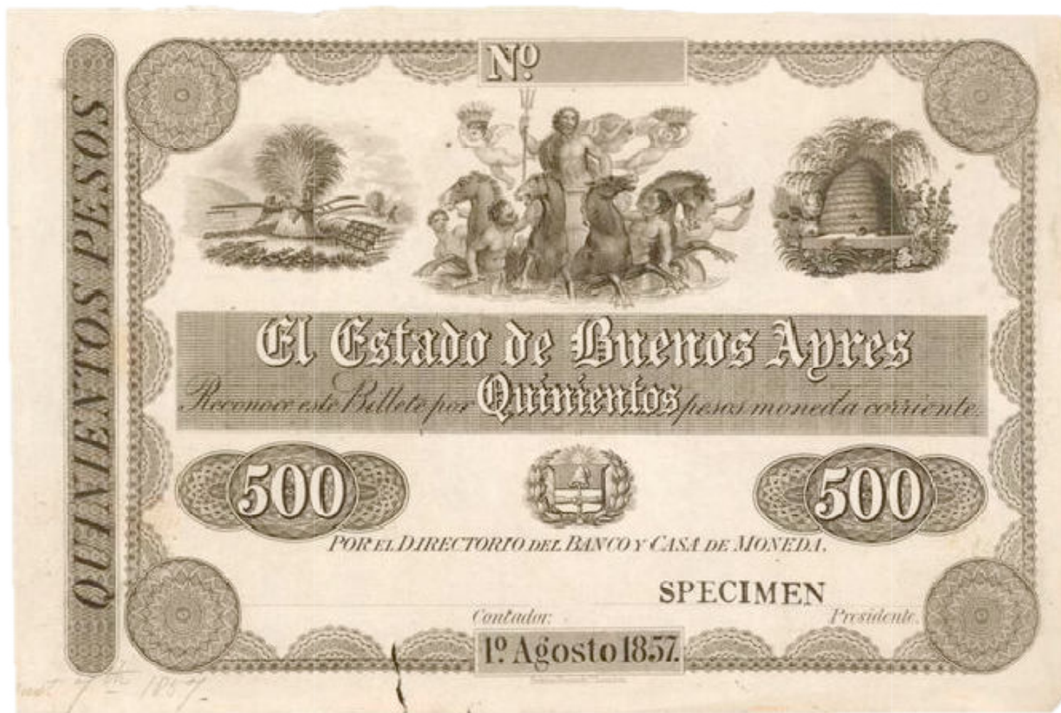
PS-426 NC-180a BA-78s1 Prueba del anverso en cartulina con resello SPECIMEN