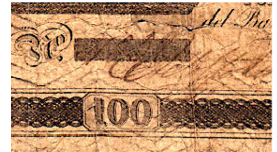
Firmado por Adolfo Lista / Javier Núñez photos CNBA

Al principio, los números se inscribieron en el espacio eclosionado proporcionado para este propósito, lo que hizo que su legibilidad fuera aún más difícil ya que la firma de la izquierda a veces lo cubría parcialmente, como en la ilustración a continuación.