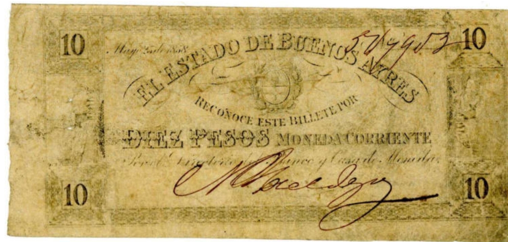
Firmante : Nemesio Hidalgo