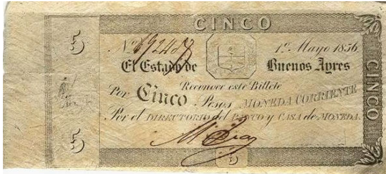
signature de Mariano Díaz placa extremadamente desgastada