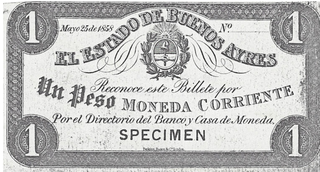
PS-429s NC-183a BA-81s Prueba en cartulina blanca con resello SPECIMEN