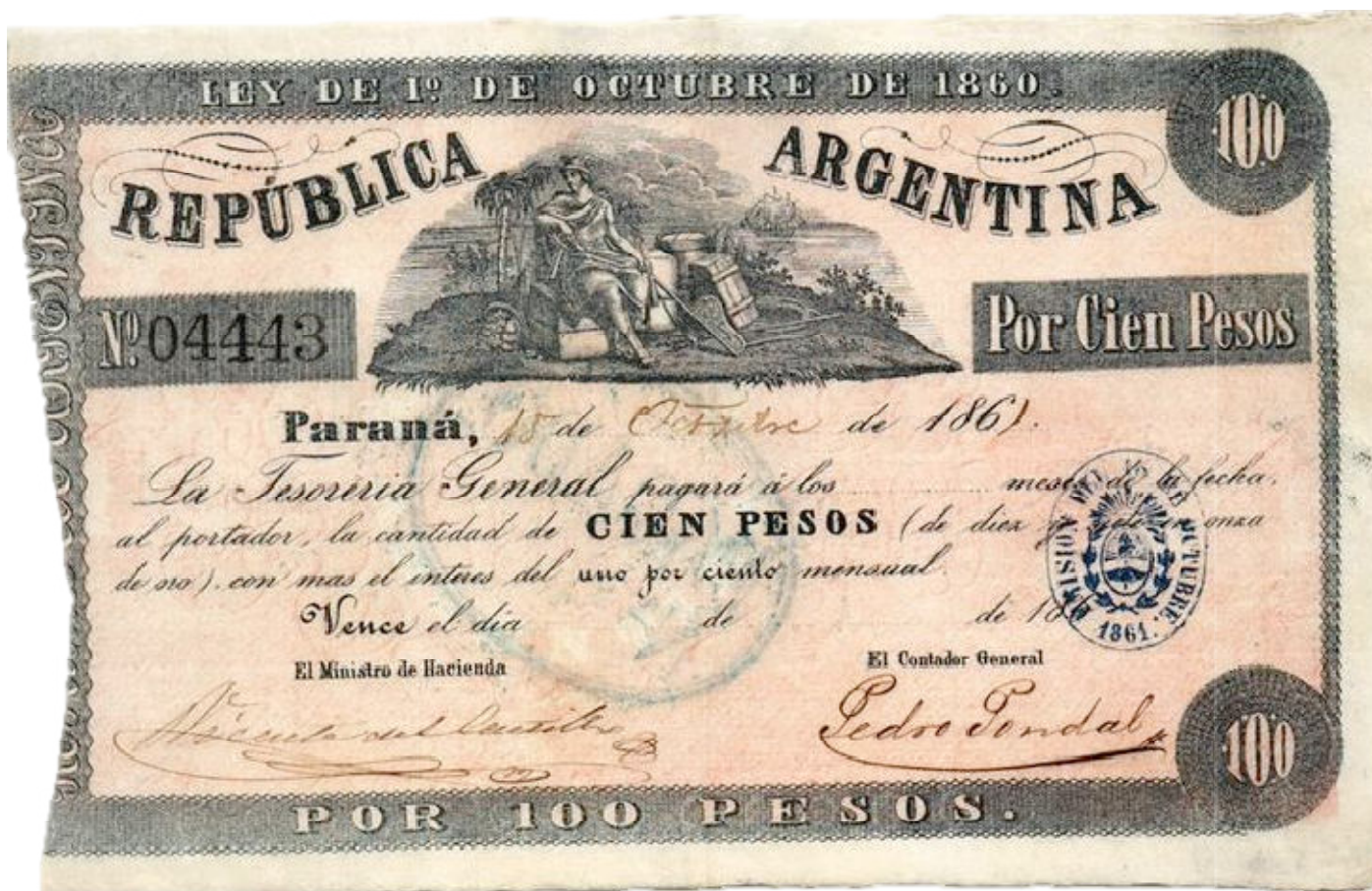
PS-230 NC-1057a CA-86a Impresión negra 15 de octubre de 1861 Sello ovalado EMISION DEL 15 DE OCTUBRE / 1861