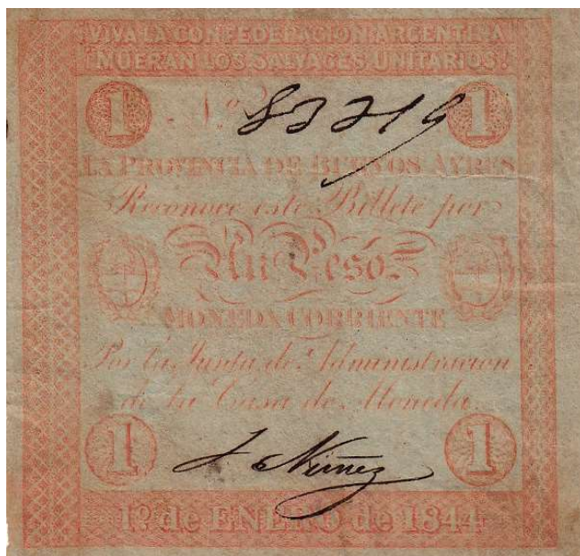
S-384a NC-139b BA-41Aa/b 1º de ENERO de 1844 papier pur chiffon blanc Alors que Nusdeo / Conno mentionnent une impression sur papel blanco de hilo , Bauman catalogue une variante sur papel blanco liso et une variante b sur papel blanco con textura .