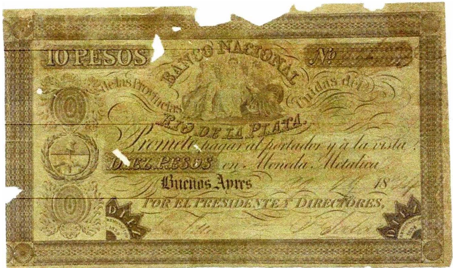
sig. Robles / Salas

PS-371c NC-121 BA-28b Dic 8 1838 émis par la Casa de Moneda 246001 - 246349