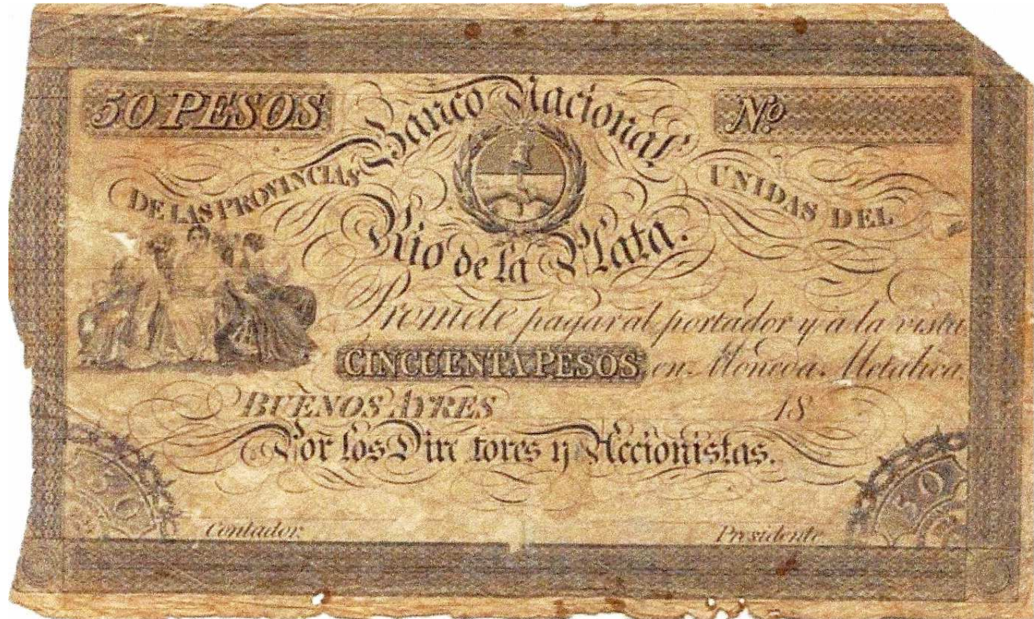
Date et signatures illisibles.

PS-373 - NC-129 BA-30 - Marzo 28 1840 émis par la Casa de Moneda inconnu à ce jour