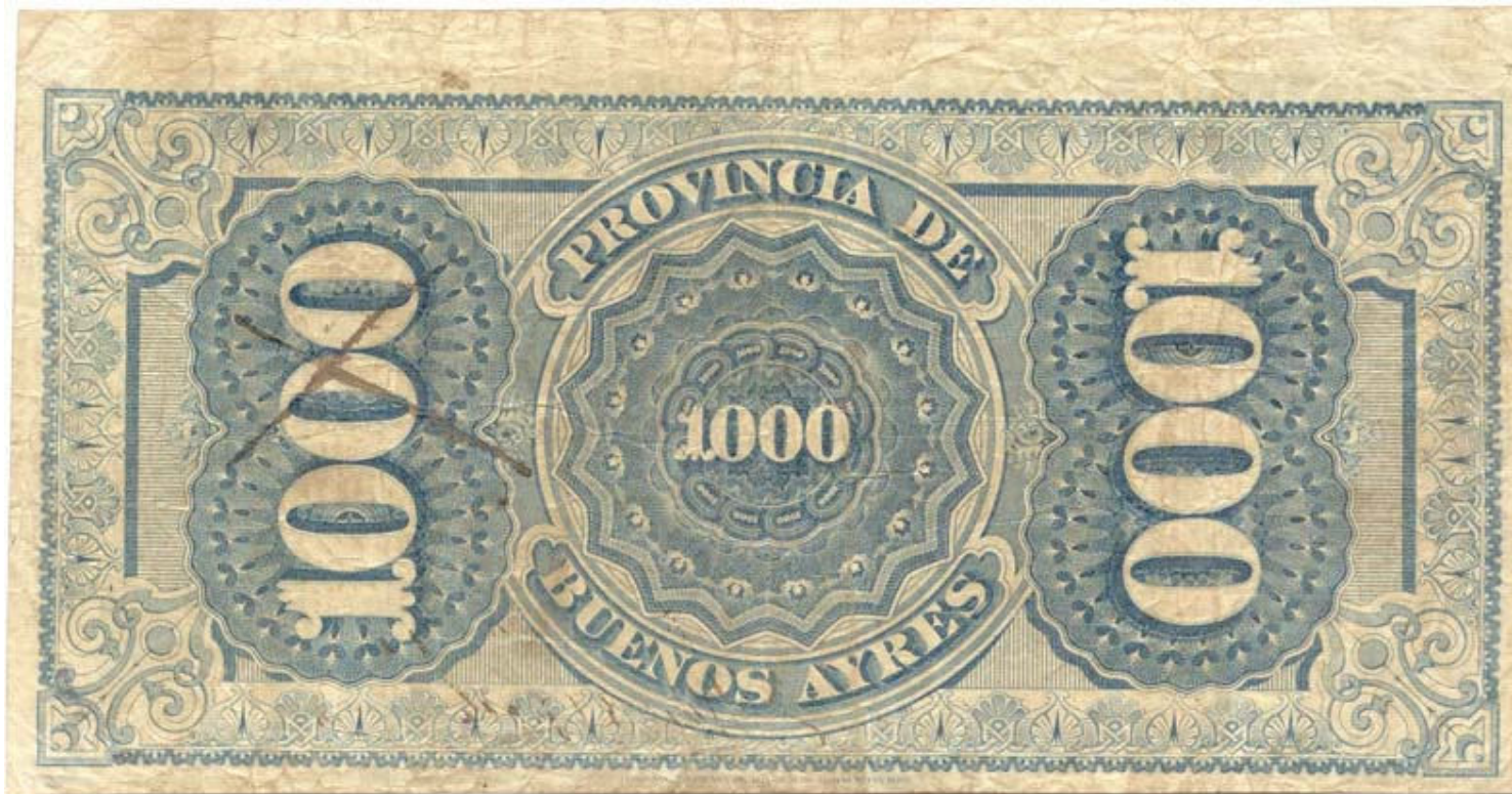
Archivo y Museo Historicos del Banco de la Provincia de Buenos Aires "Dr Arturo Jauretche"