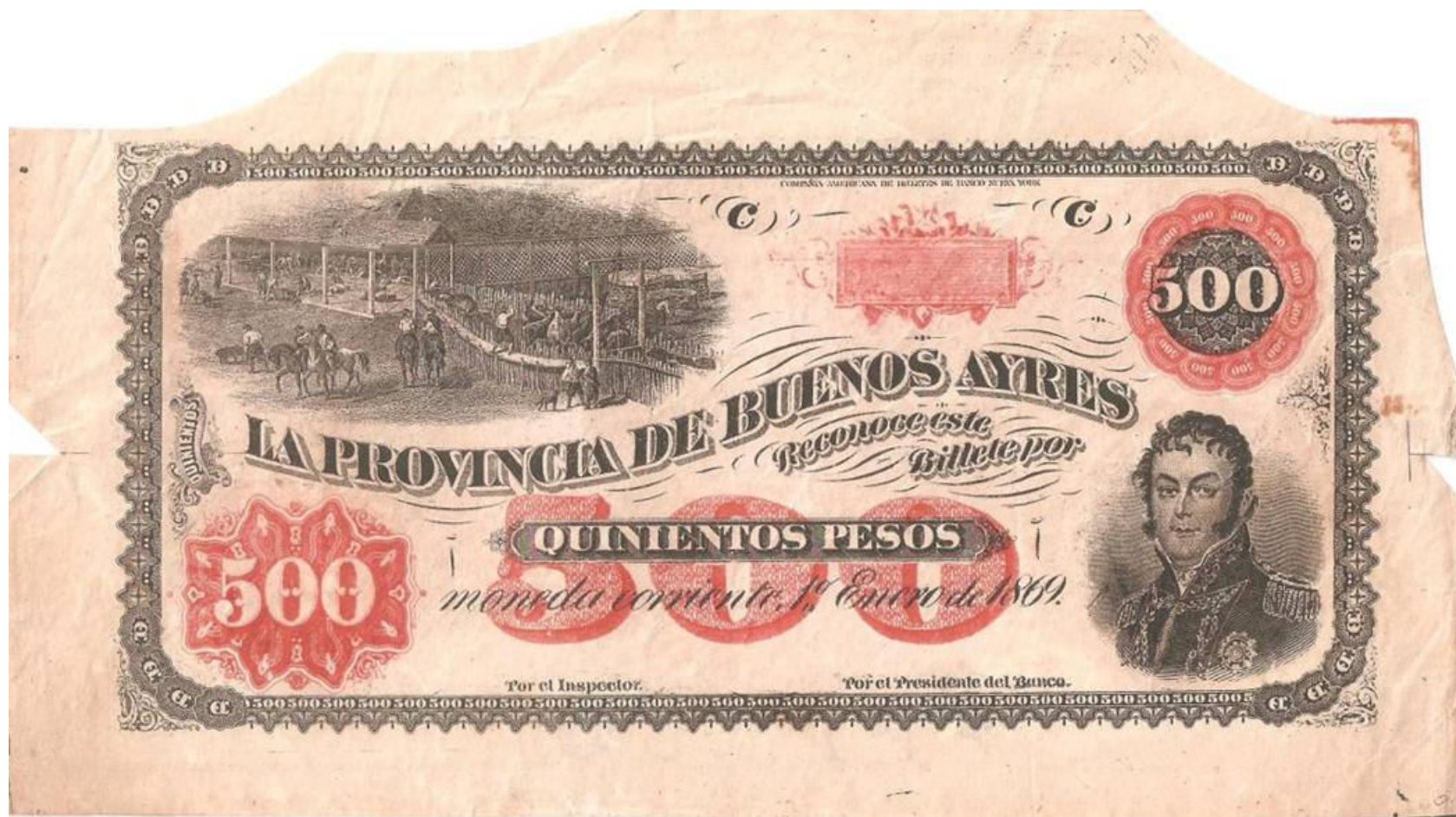
contrefaçón d'époque proposée sur mercado libre