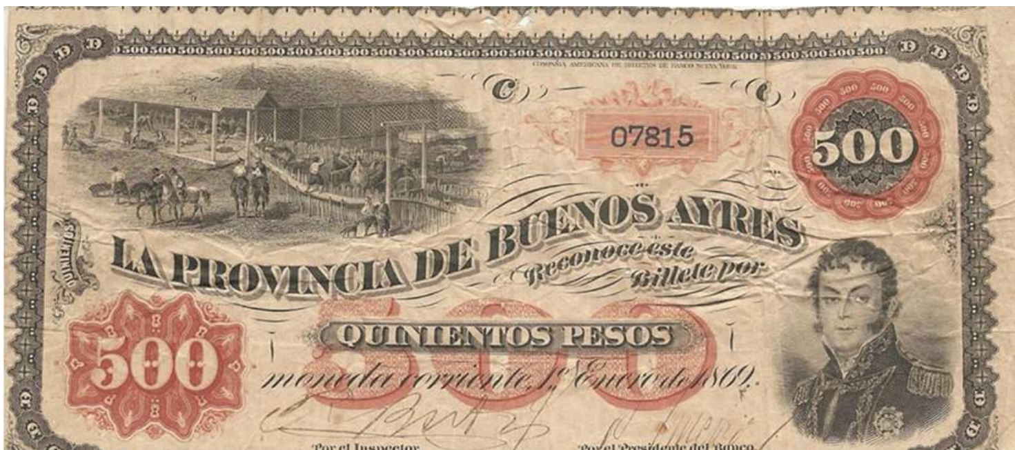
signataires Rafael Brito / Nemesio Hidalgo ?