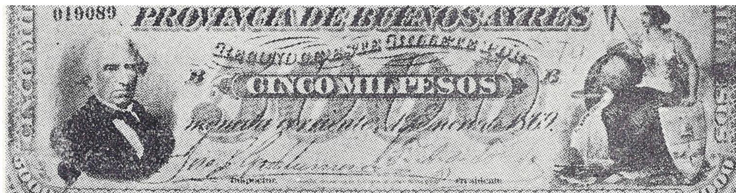
Signataires : José C. Gastelumendi / R.A. de Toledo